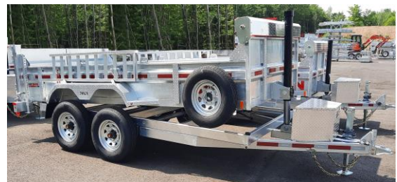
Options: Rampes, roue de secours, support de roue, pieds stabilisateurs